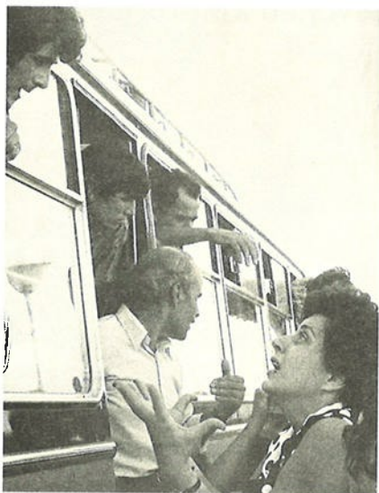
ΑΓΩΝΙΩΔΗΣ ΑΝΑΖΗΤΗΣΗ ΠΛΗΡΟΦΟΡΙΩΝ ΓΙΑ ΤΟ ΧΑΜΕΝΟ ΣΥΖΥΓΟ ΑΠΟ ΤΟΥΣ ΑΙΧΜΑΛΩΤΟΥΣ ΠΟΥ ΑΠΕΛΕΥΘΕΡΩΝΟΝΤΑΙ.

το τέλος Αυγούστου ονόματα αιχμαλώτων. Όταν ολοκληρώθηκε η διαδικασία αυτή, διαπιστώθηκε ότι πέραν των 2500 ατόμων εξακολουθούσαν να αγνοούνται. Οι συγγενείς τους άρχισαν αμέσως προσπάθειες για να τους εντοπίσουν, με δημοσιεύσεις φωτογραφιών στις εφημερίδες, με ανακοινώσεις από το ραδιόφωνο και επισκέψεις σε στρατόπεδα για συλλογή πληροφοριών από ανθρώπους που τους είδαν για τελευταία φορά. Για τους πλείστους η προσπάθεια αποδείχτηκε μάταιη. Είχαν,